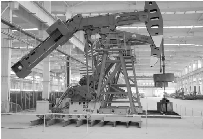
近期,由机械公司承接维修的三台抽油机已完成检修、调试、试运行工作,将交付甲方使用。

近日,市政府表彰奖励了 2017 年度全市安全生产目标责任考核先进单位,集团公司荣登表彰名册,截至 2017 年集团公司已连续三年获得全市“安全生产目标责任考核先进单位”荣誉称号。 去年以来,集团公司以习近平新时代中国特色社会主义思想为指导,深入贯彻党的十九大精神,认真落实中央、省、市关于安全生产工作的决策部署,牢固树立安全底线红线意识,完善安全生产责任体系,健全监管体制机制,狠抓隐患排查整治和应急体系建设,保证了集团公司安全生产形势总体稳定。集团公司获得“2017 年度全市安全生产目标责任考核先进单位”是集团在市委、市政府正确领导下,积极贯彻安全生产决策部署,认真落实安全生产主体责任,狠抓安全生产重点工