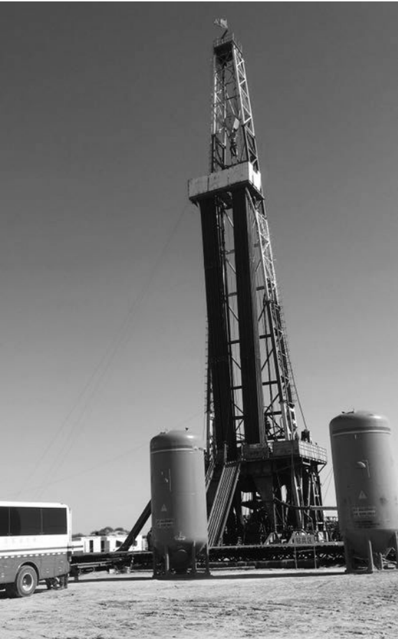
今年以来,钻采公司积极拓展钻井业务市场,目前位于内蒙古乌审旗的 50003 施工队已完成苏 36-23-4C2 气井的施工,累计进尺 3662 米。