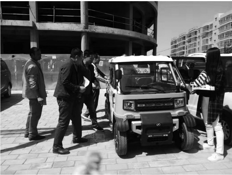
近日,机械公司”庆煊“牌电动车产品促销会在环县、正宁、宁县等地火热进行。据悉,“庆煊“牌电动车是机械公司”庆煊“家族中的最新成员,自走向市场以来,就因别致独特的外型,豪华大气的内饰,性价比经济实惠等特点受到广大消费者的青睐。

5 月 25 日,集团公司召开双联扶贫工作座谈会。集团公司驻村工作队队长孙立杰、双联工作领导小组成员及全体驻村队员参加了会议。 会上,集团公司党群工作部汇报了双联“集中整治农村环境、创建清洁美丽家园”活动的具体开展情况,并就活动开展以来存在的问题和不足进行了分析总结。 会议指出,自集团公司“集中整治农村环境、 创建清洁美丽家园”活动开展以来,双联扶贫工作队能够认真按照活动方案的统一要求,先后发放宣传读本、绿色发展等资料 500 多份,设立 6 处科普宣传栏,组织集中培训会 1 场,在改善生活质量、树立科学认知上实现了新突破,在党群互动、改进作风上取得了新成效,为全面提升村民综合素质奠定了坚实基础。 会议要求,双联活动工作小组一是高度重视,