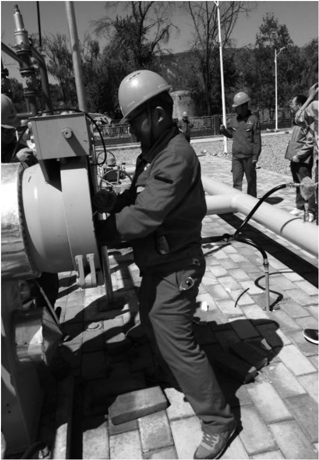
5 月 23 日,庆阳能源化工集团庆城天然气有限公司联系设备厂家现场指导员工进行过滤器维护工作。目前,气化庆阳天然气调峰项目 CNG 装置已全线安装完毕,预计 6 月 15 日进行试车运营。

为进一步开拓财务人员的视野,增强专业能力和综合素质,5 月 16 日,集团公司资产财务部组织对公司所有财务人员和财务专业人员进行了《会计基础工作规范》的培训。 本次培训紧密结合公司财务工作实际,有针对性地讲授了一些会计基础知识、集团公司财务制度与会计管理相关制度宣贯、实际操作方法及内部控制的相关内容。 培训中,同事们学习热情高,积极讨论交流,一致认为此次培训课程设置丰富、实用、管用,不仅学到了知 识,而且开阔了视野、增长了见识,达到了学有所思、学有所获、相互交流的目的,对提高财务人员综合素质和业务技能,有效加强会计基础工作,建立规范的会计工作秩序,提高会计工作水平起到积极作用。 (范焕宁)