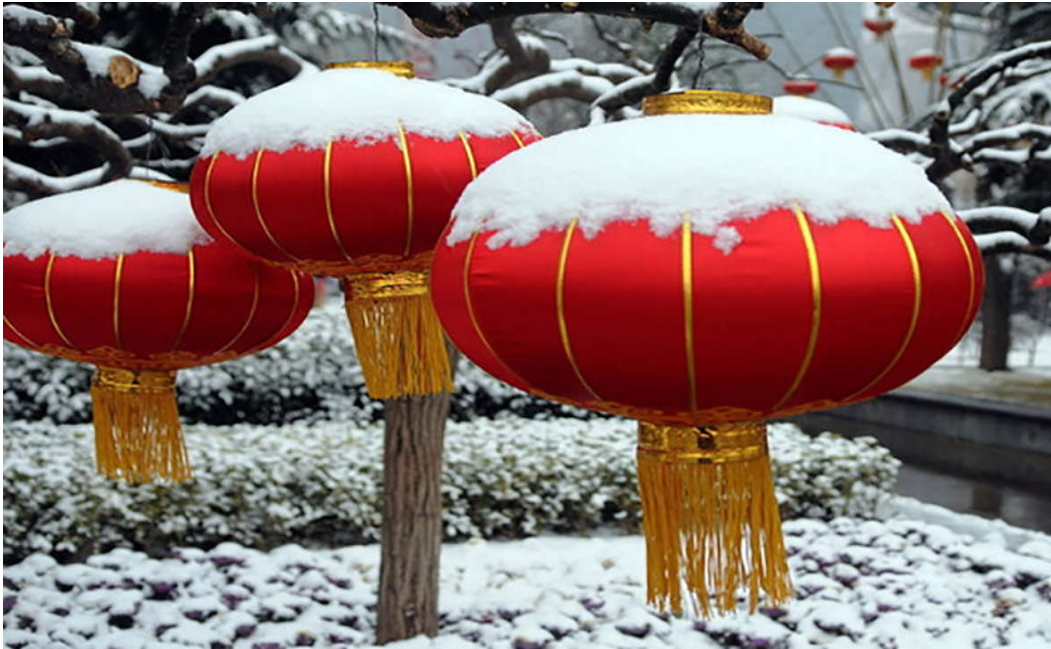
芳草地 第 55 期 红妆素裹

火声,红红的灶膛、浓浓的炊烟……伴随着初升的太阳,缕缕炊烟掠过屋顶,如雾般随风飘荡,在故乡的上空打着旋,转着圈,像恋家的游子一样,舍不得离开却又不得不走,它们亲密地拥抱着、追逐着、嬉戏着,你扯它的衣服、它拉你的手,一起向高处、向远处,越走越淡,散也散在一起。 炊烟从未离开村庄,它们的气息游走在房檐下、缠绕在南瓜藤的茎蔓间、萦绕在树梢上、掩藏在草垛里,回荡在鸟鸣中,还有那村边悠悠悠悠流淌着的小溪底,那一块鹅卵石与另一块鹅卵石的缝隙间…… 炊烟总是让人感觉温暖的,那烟火的味道和着饭香,让远行的人感到安心。