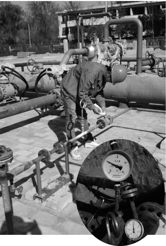
目前,“气化庆阳”天然气调峰项目已全面完成外管线试压工作,辅助用房装饰装修、刷白、内外粉刷工作正在紧张有序推进。图为技术人员正在进行外管线试压工作。

4 月份以来,集团公司“两办”在全公司机关内组织多场办公培训及实操训练,不断加强办公室 5S 管理,扎实推进集团公司办公标准化建设工作,促进企业管理水平再上新台阶。 据悉,集团“两办”严格按照 5S 管理标准,对机关办公场所、环境卫生、资料整理等进行全面规范,为创造干净、整洁、舒适的工作和办公环境,让广大员工工作更加安全、更加流畅,养成“细节决定成败”的意识,降低各种资源浪费、降低办公成本,促进集团公司 5S 活动从“形式化”走向“行事化”,最终走向“习惯化”的演变打好良好开端。 为确保办公室 5S 管理不走过场,集团“两办”成立督导组,对各子公司,集团各部门工作落实情况进行全面检查,促使员工工作提高修养,规范行为,树立追求并创造良好办公环境的自律精神,时刻保持良好的工作状态。(张建恒)