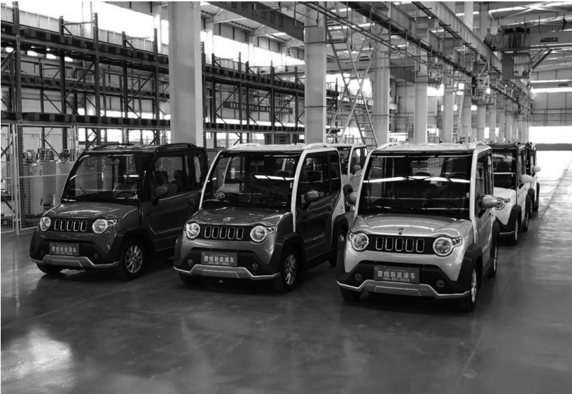
近日,庆阳能源化工集团节能服务有限公司“庆煜”家族迎来新成员——庆煜新能源车,该产品具有性能优越、安全系数高、操作简便、绿色环保,一经推出便受到广大消费者青睐,目前销售情况良好。

4 月 27 日,集团公司安全环保部针对各子公司一季度安全考核结果,对各子公司主要负责人、安全管理人员及相关从业人员等 50 多人进行了专项培训和警示教育。 会上,集团公司安全环保部认真分析总结各子公司一季度考核存在的问题,深层次剖析问题实质,通过制定专项治理方案,使各级安全管理人员进一步明确了岗位职责,细化了工作内容。 培训讲师通过详细解 读《安全生产法》和《甘肃省安全生产条例》重点内容,并结合自身工作经验,分享交流了中石油长庆油田安全管理上的具体措施和方法。针对各子公司自身安全管理现状,与各级安全管理人员积极分析讨论,就如何迅速有效的开展风险过程监控和循环渐进的完善体系建设工作等问题为参训人员答疑解惑,并采用大量事故案例和图片与参训人员分析交流事故发生的根本原因,剖析安全管理短板,让大家时刻警惕风险就在身边,隐患无处不在。只有坚守安全红线,强化工作措施,重点环节不懈怠、不遗漏、不松手、不疏忽、不动摇,才能做好今后安全生产管理工作。 通过开展此次培训,进一步提高了各级安全管理人员安全监管水平,弘扬了企业安全文化、营造了集团公司良好的安全发展氛围,为集团公司二季度安全生产管理工作夯实了基础。 (安全环保部 赵峰)