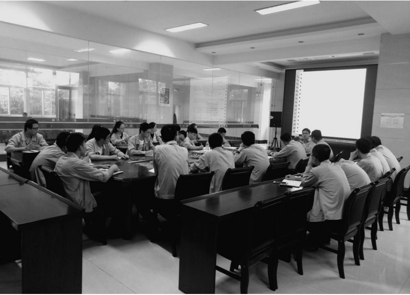
截至目前,庆阳能源化工集团庆福智能科技有限公司 25 名员工在福建漳州富顺光电科技园培训 50 多天,他们分别在充电桩车间,半成品车间和金融对讲机车间进行实操练习,大家秉承勇于进取,一丝不苟,精益求精的工作理念,圆满完成车间下达生产产量,赢得公司领导及车间主任一致好评,最近又安排六课时的电子产品理论学习,图为公司员工参加产品培训会现场。