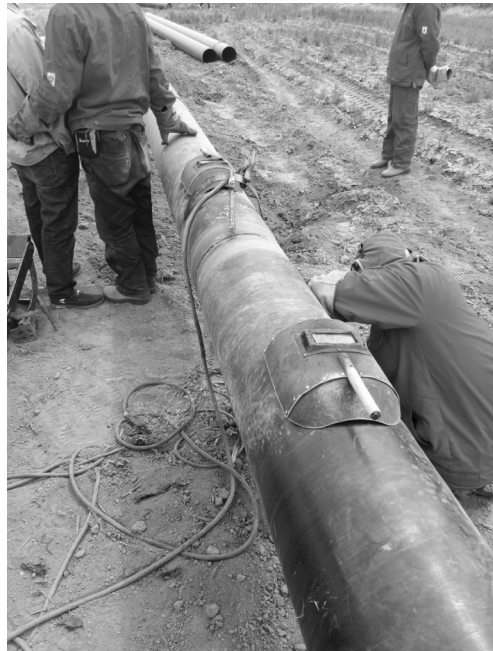
图为“庆化专线”项目 16# 桩施工现场。

南佐—西峰工业园区输气管线“庆化专线”项目,主要是将南佐门站的天然气通过管道输送至西峰工业园区,为工业园区的用户提供气源保障。 该项目对南佐门站进行扩建,主要功能为接收西二线平泉分输站来气,经过滤、调压、计量后给西峰工业园区调压站供气;新建南佐门站—西峰工业园区调压站间约 9.5km 的高压 A 燃气输送管道,设计压力 4.0MPa,采用 D323.9×7 无缝钢管;新建西峰工业园区调压站 1 座,主要功能为接收南佐—西峰高压 A 燃气管道来气,经过滤、计量后给庆阳瑞华能源有限公司和庆阳石化公司供气。远期设计规模 4.46×108Nm³/a,项目总投资估算约 3507.12 万元。