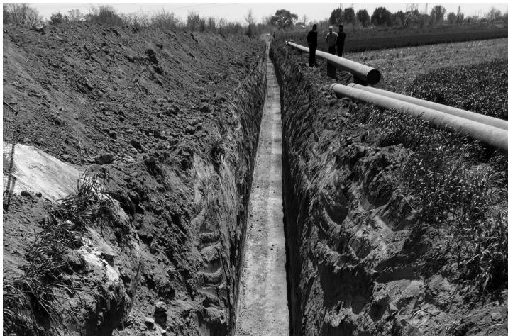
图为“庆化专线”项目 17# 桩施工现场。