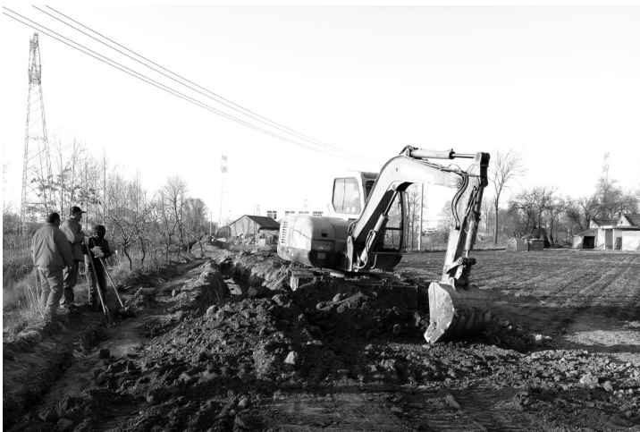
图为工作人员正在进行 26# 至 27# 桩间测量及土方回填施工作业。