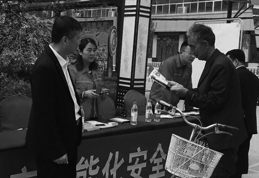
图为钻采公司安全宣传员为群众讲解安全知识

为了扩大公司安全培训中心影响力,按照公司安全培训目标要求,4 月 23 日钻采公司安全培训中心人员赴庆城县普照寺广场开展了主题为“安全伴我行”的宣传活动。 本次活动以发放安全培训宣传单、摆放宣传展架、悬挂宣传横幅、设立现场咨询台和接受群众现场咨询等形式展开。 活动期间,宣传人员围绕公司培训工种、培训形式、交通安全、消防安全、平安创建、生产安全等多方面的法律法规,通过解答疑虑、讲解知识、提示要求等形式为居民群众普及防范知识,正确引导群众参与平安庆阳创建,提升全社会安全意识。现场共发放安全培训宣传单 500 余份、接受咨询 300 余人次,气氛十分热烈。 通过此次活动,进一步强化了群众的安全意识,提高了公司安全培训中心的影响力,达到了宣传目的。 (张彬霖)