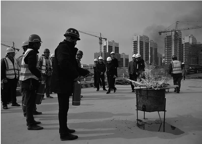
图为施工人员正在示范灭火器使用方法

为了进一步加强施工现场消防安全管理工作,增强员工消防安全意识,普及消防安全知识,提高火灾应急处置能力。近日,宏泰置业有限公司组织中建二局三公司、庆阳鑫磊工程项目管理咨询有限公司现场工作人员 40 余人开展了消防应急演练。 据悉,本次演练主要围绕火灾发生后的扑救、控制、现场协调指挥,物资转移演练和火场人员疏散引导、伤员救护演练等内容。演练结束后,安全部门负责人对灭火器的使用进行讲解,现场向大家展示干粉灭火器材的使用方法和扑火过程中的注意事项以及在遇到火情时的一些应急方法。参加演练的工作人员,特别是新员工进行了现场实操体验,进一步提高了对基本灭火设施的实操能力。 经过这次消防应急演练,检验了施工现场工作人员对应急事件的处置能力,对应急程序和实际操作技能的掌握,达到了预期效果。大家纷纷表示:“通过本次消防演练,提高了自身的安全意识,最重要的是学会了灭火器如何正确使用,对以后的工作和生活帮助非常大。” (黄家珍)